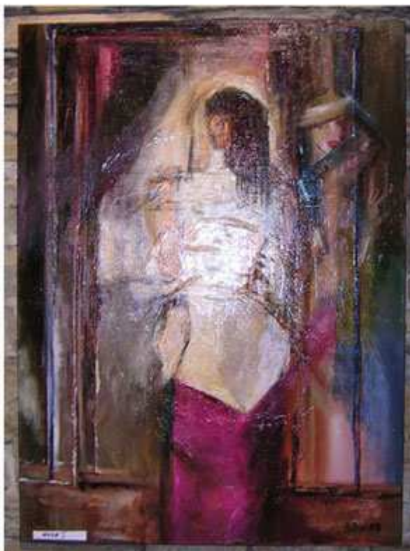
Jedną z takich faktur miał na myśli Łukasz Glazer.